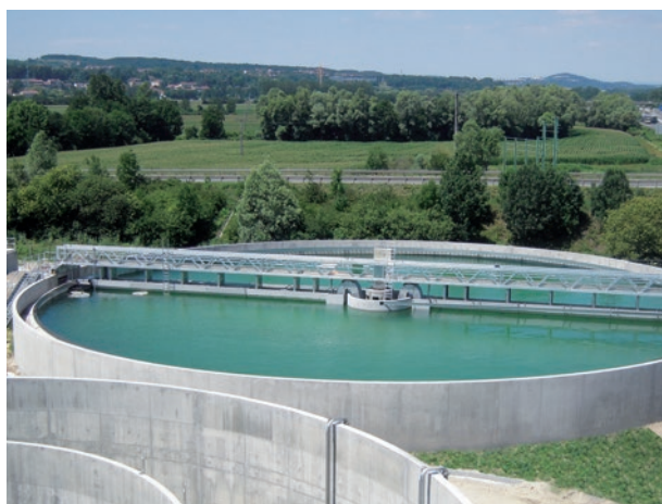
STATION D'ÉPURATION Bourgoin-Jallieu (Isère)