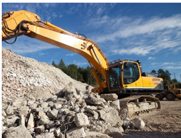
VALORISATION DE GRANULATS RECYCLÉS ISSUS DE LA DÉCONSTRUCTION