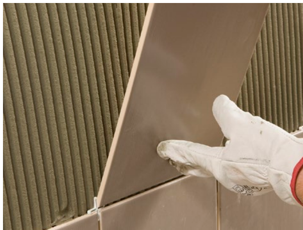
COLLE À CARRELAGE