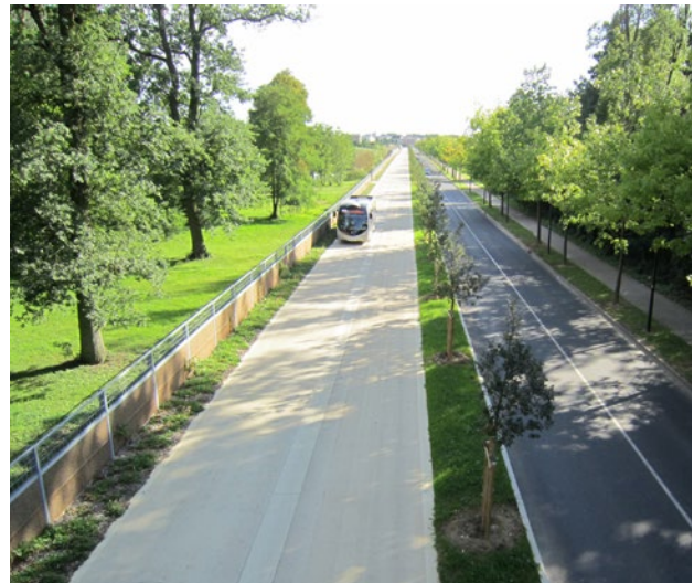
LIAISON TRAM-BUS Île-de-France