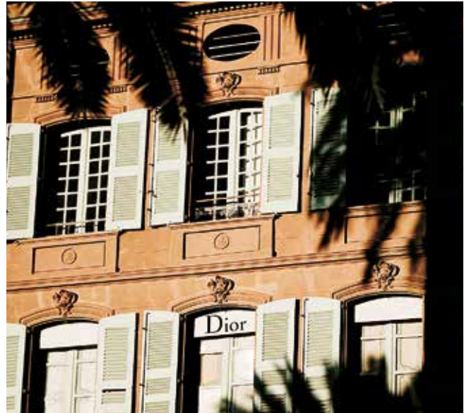
RESTAURACIÓN DE LA FACHADA DE LA VILLA DE LA EMBAJADA, ESTABLECIMIENTO DIOR Saint-Tropez (83) – Estudio de arquitectura LAC – Empresa Les Ateliers du Paysage