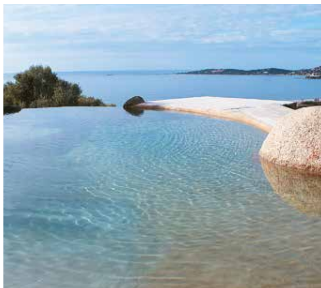
IMPERMEABILIZACIÓN DE ESTANQUE