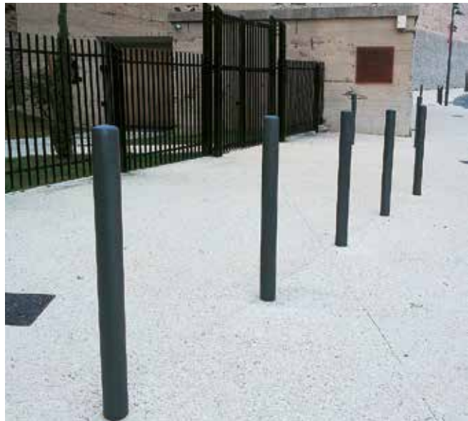
EMPOTRAMIENTOS DE BOLARDOS