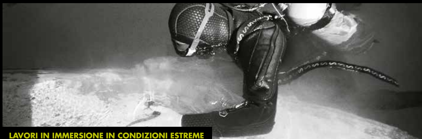
LAVORI IN IMMERSIONE IN CONDIZIONI ESTREME