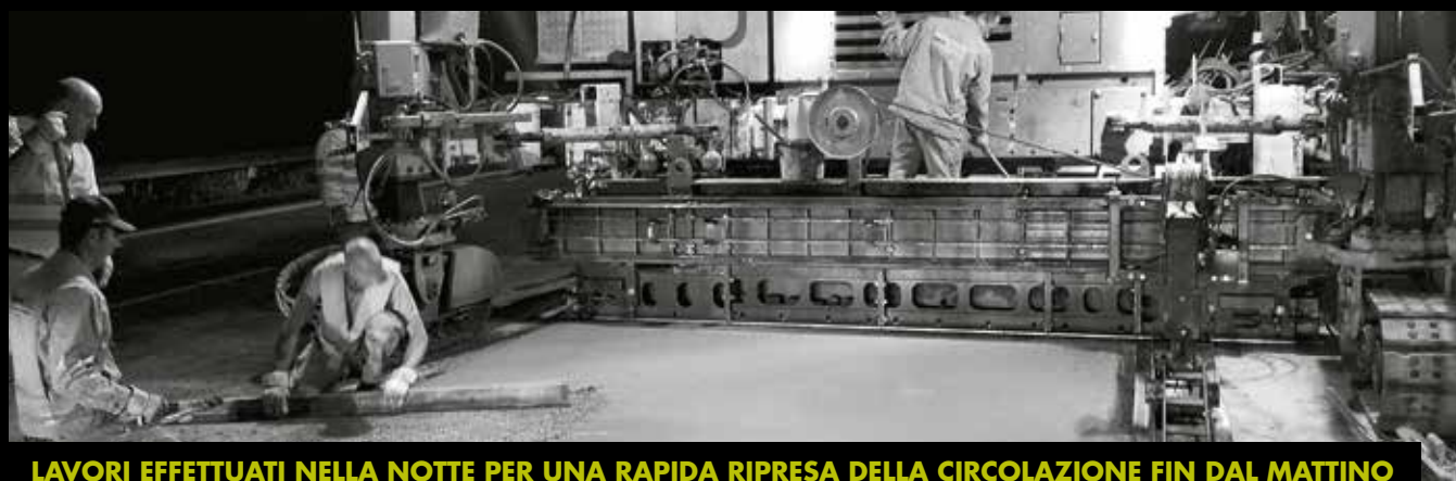
LAVORI EFFETTUATI NELLA NOTTE PER UNA RAPIDA RIPRESA DELLA CIRCOLAZIONE FIN DAL MATTINO