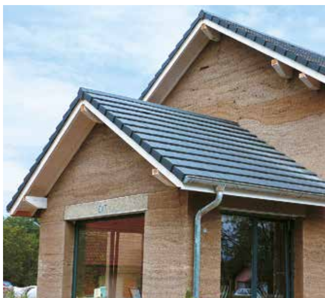
CASA IN CALCESTRUZZO DI CANAPA Arbusigny (Alta Savoia)