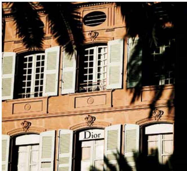
RESTAURO DELLA FACCIATA DELLA VILLA DELL'AMBASCIATA, NEGOZIO DIOR Saint-Tropez (83) – Studio di architettura LAC – Impresa esecutrice Les Ateliers du Paysage