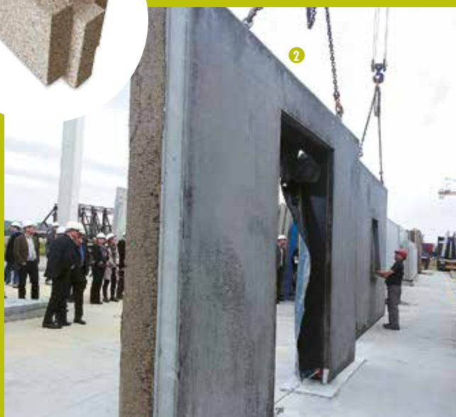
(1) BLOCCO DI CALCESTRUZZO DI CANAPA A INCASTRO