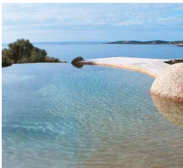
IMPERMEABILIZZAZIONE DI BACINO