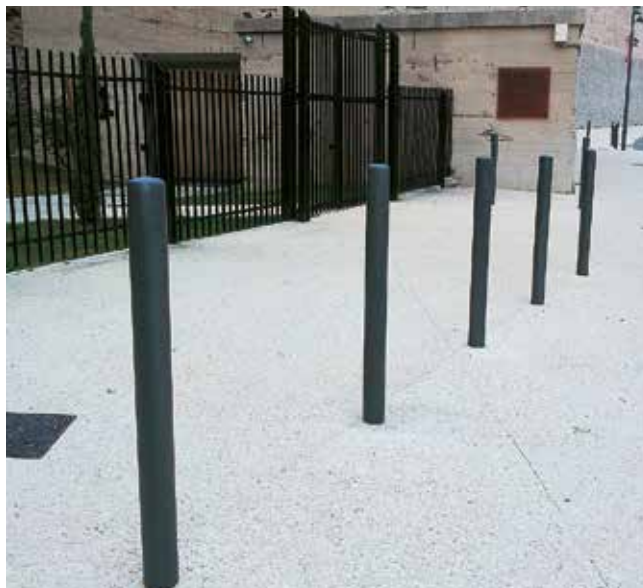
FISSAGGIO DI PALETTI