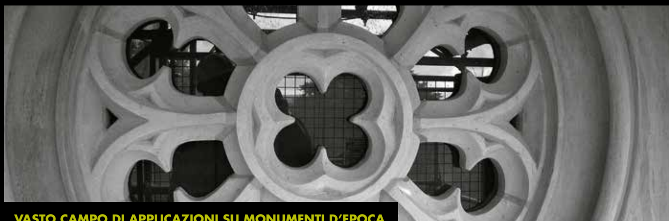
VASTO CAMPO DI APPLICAZIONI SU MONUMENTI D'EPOCA