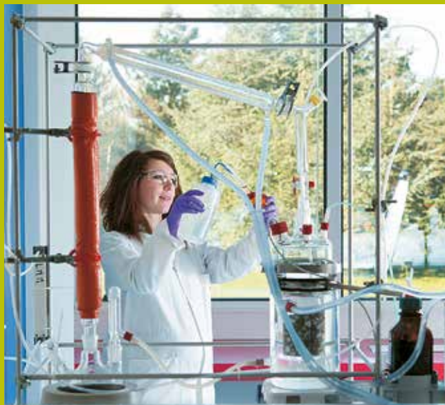
CENTRO TECNICO LOUIS VICAT L'ISLE D'ABEAU (38)